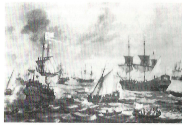
Abb. 2: Die brandenburgische Flotte, Gemälde von Verschuier.

Im Jahre 1680 rüstete der Kurfürst wieder mehrere Kriegsschiffe aus, um einen Kaperkrieg gegen Spanien zu führen. Spanien schuldete den Brandenburgern 800.000 Taler Hilfspgelder, weil die Armee des Großen Kurfürsten Spanien im Krieg gegen