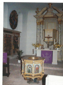
Abb. 4: Lichterfelder Dorfkirche: Altar, links davon das Grabgemälde.