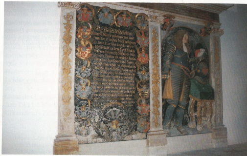
Abb. 5: Lichterfelder Dorfkirche: Grabgemälde (Doppelrelief) Rechte Platte: Darstellung des FRIEDRICH OTTO VON DER GROEBEN in lebensgroßer Figur als Hochrelief. Linke Platte: Totentafel seiner Gemahlin MARIA VON LOE.