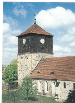
Abb. 3: Lichterfelder Dorfkirche: Außenansicht..

Zum Schluß dennoch einige Worte zu dem Ausgangspunkt unseres Artikels. Das Grabdenkmal von FRIEDRICH OTTO VON DER GROEBEN befindet sich links vom Altar der Lichterfelder Kirche, deren älteste Teile vermutlich aus dem 13. Jahrhundert stammen. Über den Bau der Kirche selbst sind wenig gesicherte Erkenntnisse vorhanden; erst für die Zeit nach dem Dreißigjährigen Krieg geben die Kirchenbücher Auskunft über Umbauten und Renovierungen an der Kirche. 1680 ist dort vermerkt, daß FRIEDRICH OTTO VON DER GROEBEN für sich und seine Frau ein Grabgemälde anfertigen ließ. Es handelt sich um ein Doppelrelief. Die rechte Grabdenkmalplatte stellt FRIEDRICH OTTO VON DER GROEBEN in lebensgroßer Figur als Hochrelief dar. Er ließ sich im Eisenpanzer abbilden, mit Feldbinde um Hals und Arm, die Linke gestützt auf einen offenen Visierhelm. An seiner linken Seite hängt der mit goldenen Griff versehene Degen, die rechte Hand hält den Kommandostab (dieser fehlt heute). Die linke Grabdenkmalplatte ist die Totentafel seiner Gemahlin MARIA VON LOE. Über dem Epitaph ist das Wappen der Familie von DER GROEBEN angebracht. Ebenso wie viele andere Gegenstände in der Kirche und wie das Kirchengebäude selbst mußte das Epitaph einer grundlegenden Sanierung unterzogen werden. In der „Festschrift zur Wiederindienstnahme der evangelischen Kirche Lichterfelde am 9. Juni 1996“ heißt es: „Die in den letzten Jahrhunderten immer stärker aufretende Feuchtigkeit im Mauerwerk hat das Epitaph stark geschädigt und ge-