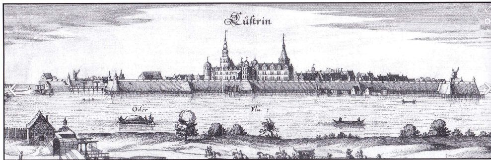
Abb. 6: Festung und Residenzschloss Küstrin, Kupferstich von Matthäus Merian, publiziert 1652