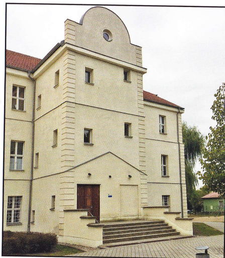
Abb. 2: Lichterfelde Herrenhaus („Schloss“) 2019.