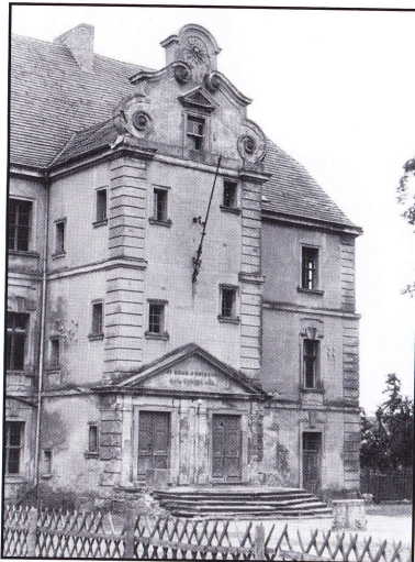
Abb. 1: Lichterfelde Herrenhaus („Schloss“), Treppenanbau, Aufnahme um 1960. BLDAM-MBA, PK000997

Dieser Beitrag knüpft an meine Ausführungen zur ersten Baugestalt des Herrenhauses in Lichterfelde im Jahrbuch 2018 an. 2 Darin wurde bereits beiläufig erwähnt, dass zur Entstehung des Gebäudes eine Sage in mehreren Versionen überliefert ist, in der auf das damalige Baugeschehen und auf einige der daran beteiligten Personen Bezug genommen wird. In allen diesen Versionen bildet die aus späterer Sicht als merkwürdig empfundene Bauweise des „Sparrenschlosses“ das Ausgangsmotiv. Offenbar beflügelte hierbei insbesondere der Treppenturm vor der Hauptfront bzw. das Fehlen einer Treppenanlage im Gebäudeinneren die Phantasie der nachgeborenen Einwohner in und um Lichterfelde. Wie für diese literarische Gattung typisch, war auch die Lichterfelder Sage zunächst mündlich von Generation zu Generation weitergegeben worden. Im Verlauf der Zeit haben die Erzähler dabei historische Fakten, Ereignisse und Personen zunehmend mit subjektiven Beobachtungen, Spekulationen und unterhaltsamen Ausschmückungen vermischt. Der Wahrheitsgehalt schwand, Tatsache und Fiktion verschwammen ineinander und sind für uns heute kaum mehr auseinanderzuhalten.