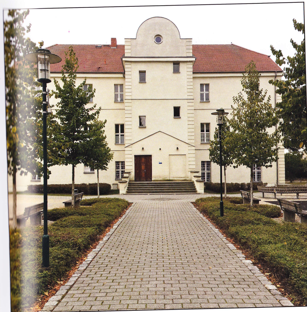
Abb. 9: Herrenhaus Lichterfelde („Schloss“) 2019.

Interessant wäre es, die Urfassung der von Bellermann lediglich in Kurzform wiedergegebene Sage aus dem Frankfurter Jahreskalender von 1824 und auch andere existierende Fassungen nochmals in einer Zusammenschau zu lesen. Vielleicht würde man dabei auf weitere erhellende Spuren zur frühesten Geschichte des alten Lichterfelder „Sparrenschlosses“ stoßen.